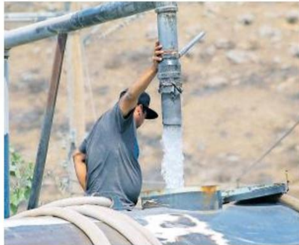
En la ciudad se sigue aplicando el programa de tandeos de agua